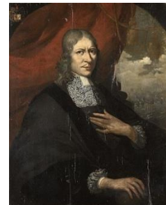
Rijcklof van Goens