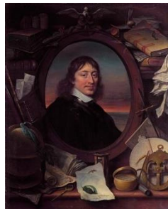
Gerard Pietersz. Hulft (Govert Flinck)