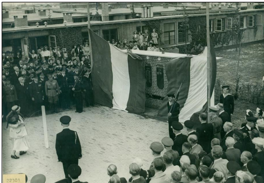
H.M. Koningin Wilhelmina onthult het monument.