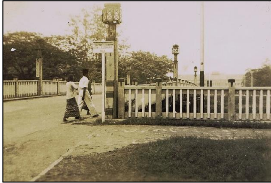
De Anton J. Bussemaker brug, ca. 1948.