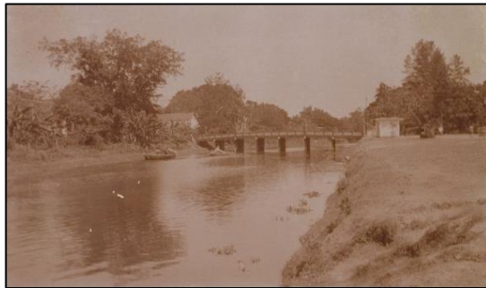
Japansche brug ca.1920.